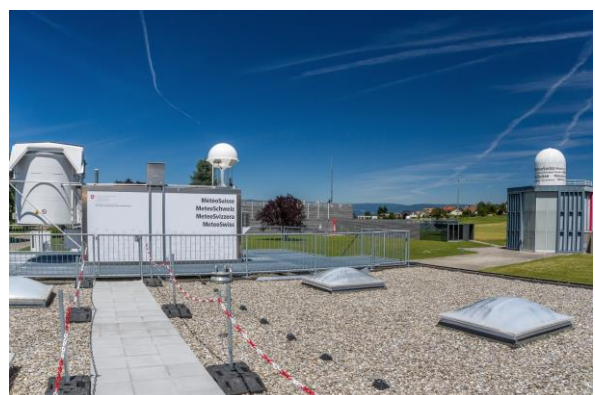
Links die Anlage zur automatischen Auflassung der Ballonsonden und rechts die Halle, in der die Ballons für die spezifischen Radiosondierungen gefüllt werden.