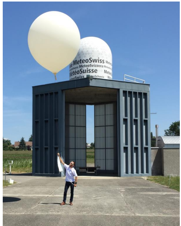
Die Ballonsonde wird von Hand in die Atmosphäre aufgelassen.

Es gibt über 600 Stationen für die aerologische Sondierung, die in unregelmässigen Abständen über die gesamte Erde verteilt sind. All diese Stationen entsenden simultan alle zwölf Stunden Sonden in die Atmosphäre. Die hierbei ermittelten Informationen werden mittels spezieller Kommunikationsnetze allen nationalen Wetterdiensten zur Verfügung gestellt. Dort werden sie auf den Höhenwetterkarten eingezeichnet und analysiert. Darüber hinaus werden sie in numerische Modelle eingespeist und verbessern so die Qualität der Wettervorhersagen. Ungefähr 170 dieser Stationen müssen zusätzliche Anforderungen erfüllen: Sie dienen der langfristigen Klimaüberwachung. Die aerologische Station in Payerne ist Teil eines weltweiten Netzes von Referenzstationen für die Klimaüberwachung (GRUAN-GCOS Reference Upper-Air Network).